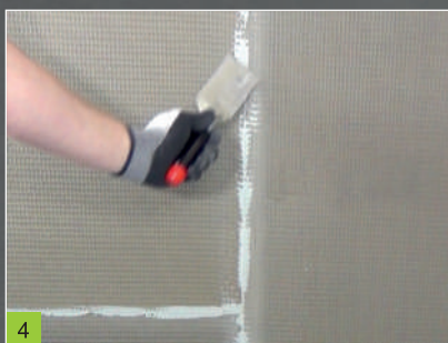
4 Zahlazení vytlačeného tmelu