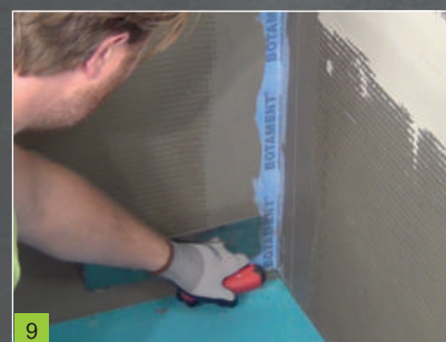
9 Zatření okrajových částí pásky