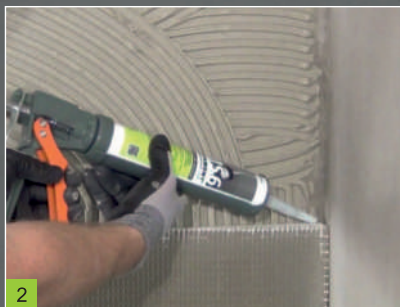
2 Lepení spojů konstrukčních desek BP tmelem BOTAMENT® MS 6 (Upozornění: netvořit spáry do kříže)