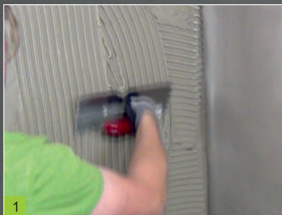
1 Natažení lepidla BOTAMENT® M 21

produkty BOTAMENT® MS 6 a BP konstrukční desky