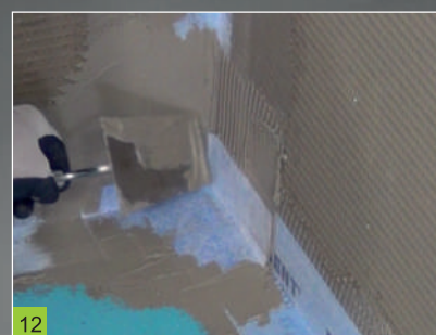
12 Zatření okrajových částí koutového prvku

Údaje v tomto prospektu vycházejí z našeho nejlepšího vědomí a zkušeností, jsou však nezávazné. Je nutné zohlednit podmínky v daném stavebním objektu, účel použití a specifické místní zatížení. Za těchto předpokladů ručíme za správnost údajů v rámci našich obchodních podmínek. Doporučení našich spolupracovníků, která se odchyľují od údajů našeho prospektu, jsou pro nás závazná, jestliže byla písemně potvrzena. Pro dosažení optimálních výsledků doporučujeme vždy provést zkoušku zpracování ve specifických podmínkách přímo na dané stavbě. V každém případě je nutné dodržovat všeobecně známá pravidla technologických postupů a nejnovější poznatky. Vydání 1904. Technologický postup je uveden v technickém listu produktu.