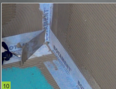
10 Uložení izolační pásky BOTAMENT® SB 78 přes napojení desek BP a sprchový desek