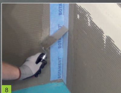
8 Uložení izolační pásky BOTAMENT® SB 78 do čerstvé vrstvy MD 1 Speed