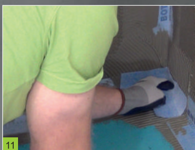
11 Uložení hotových prvků izolační pásky BOTAMENT® SB 78 kout