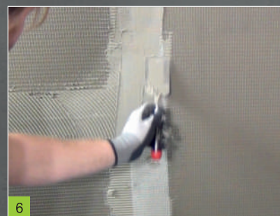
6 Zatažení pásky lepidlem BOTAMENT® M 21