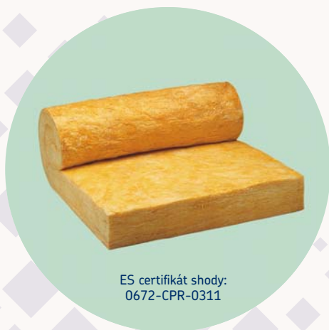
ES certifikát shody: 0672-CPR-0311